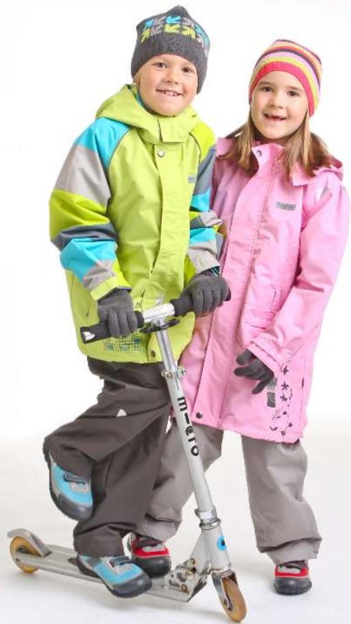
City Jonathan takki