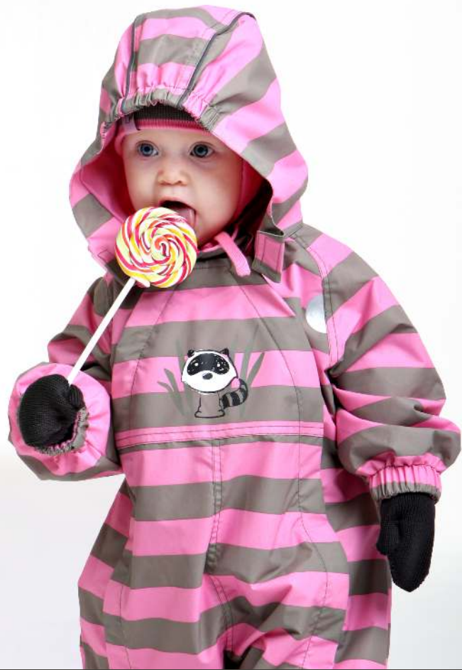
City Jonathan housut