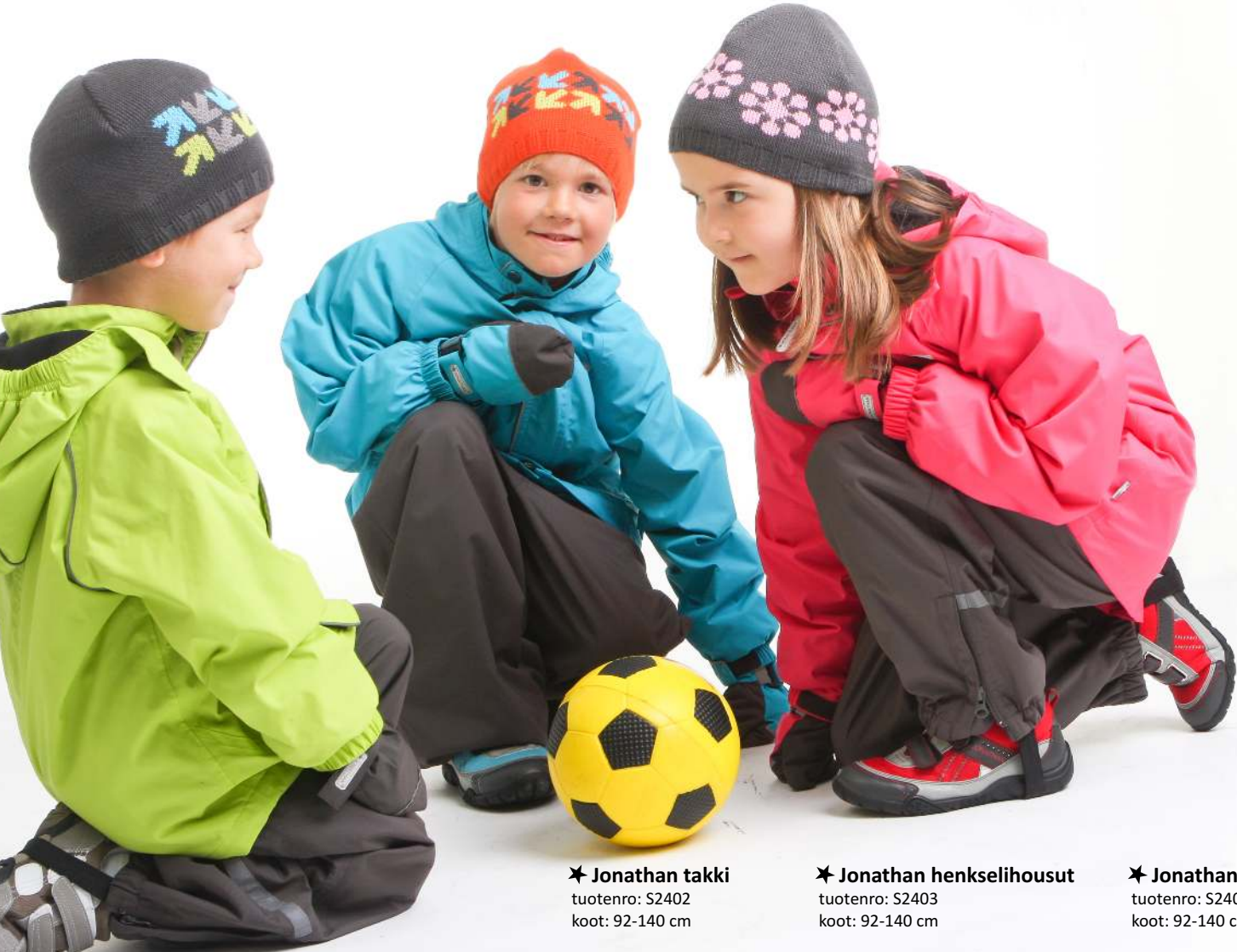
★ Jonathan takki tuotenro: S2402 koot: 92-140 cm